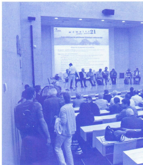
Mémoire 21 Valais-Wallis, Urs Mischler

Kulturerbe! Dank einer breiten Absprache kann Mémoire 21 Valais-Wallis der Bevölkerung und den Behörden einen Massnahmenplan vorlegen, der auf alle aktuellen Herausforderungen eingeht, von der Rettung dieses gemeinsamen unwiederbringlichen Erbes zu seiner möglichen Rolle für die Zukunft des Wallis und der Schweiz. Treffpunkt am 28. April!