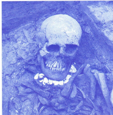
SBMA/ARIA SA, Sion

Im Rahmen des Projekts „Fundort des Monats“ laden Sie die Dienststelle für Hochbau, Denkmalpflege und Archäologie des Kantons Wallis und das Tourismusbüro Sion zu einem Rundgang durch die Walliser Kapitale ein, der Sie zu Grabstätten und Friedhöfen aus fast 7 Jahrtausenden führen wird, was in dieser Art und Dichte für die Schweiz einmalig ist! Dabei werden sich dem öffentlichen Publikum von Mitte April bis Ende August 2016 eine ganze Reihe von Fundstätten präsentieren.